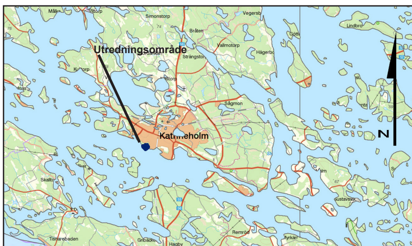
Fig. 3. För 7 000 år sedan låg utredningsområdet invid en forntida fjärd. Katrineholms-trakten var då ett skärgårdslandskap. Utdrag ur fastighetskartan. Skala 1:250 000.

Området ligger på nivåer mellan 40 och 50 meter över havet. Det innebär att de högsta bergstopparna i området torrlades under senare delen av äldre stenålder då området var en flikig skärgård. I närliggande delar av Katrineholms trakten har det påträffats ett stort antal boplatser från både äldre och yngre stenålder. Flera av dessa ligger på nivåer mellan 40 och 50 meter över havet. Här ska tilläggas att det rör sig om boplatser som varit strandbundna men också om yngre boplatser som legat på avstånd från stranden.