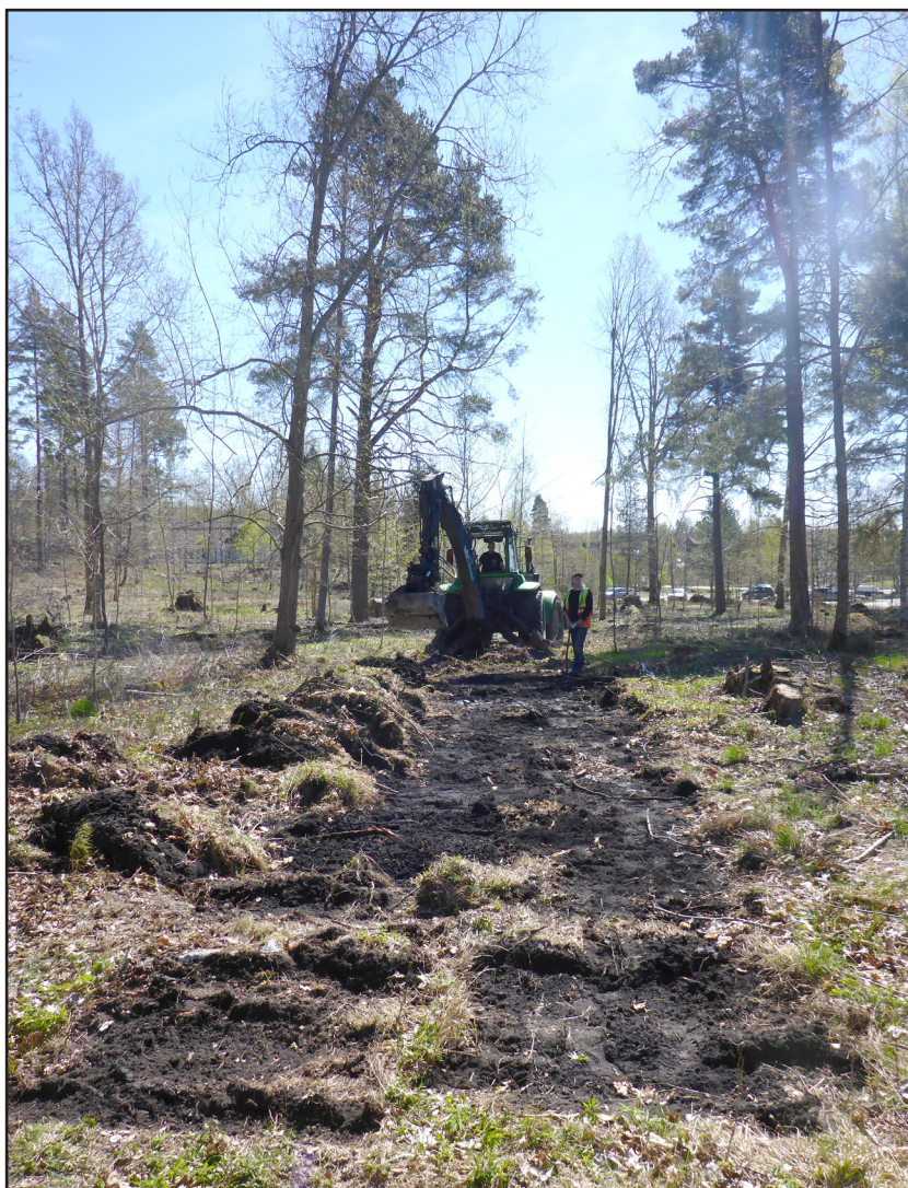
Fig. 6. Inom objekt 3 i schakt 1 påträffades rester av en majbrasa, objekt 7 . På bilden syns hur schaktet lagts tvärsöver majbrasan som inte kunde skönjas innan avtorvning.

I ett schakt framkom ett tjockt lager med sot och kol som först tolkades som en kolmila. men genom studie av kolmaterialet och en avgränsning av området genom provstick i området visade det sig att lämningen var mycket oregelbunden och med ett kolmaterial som inte hade några likheter med materialet i kolmilor. Kolet var varierat från små pinnar till tjocka grenar och även någon plank! Lämningen fick sin förklaring när en boende i området kom på besök och kunde berätta att det var rester av baptisternas majbrasa som vi grävde i.