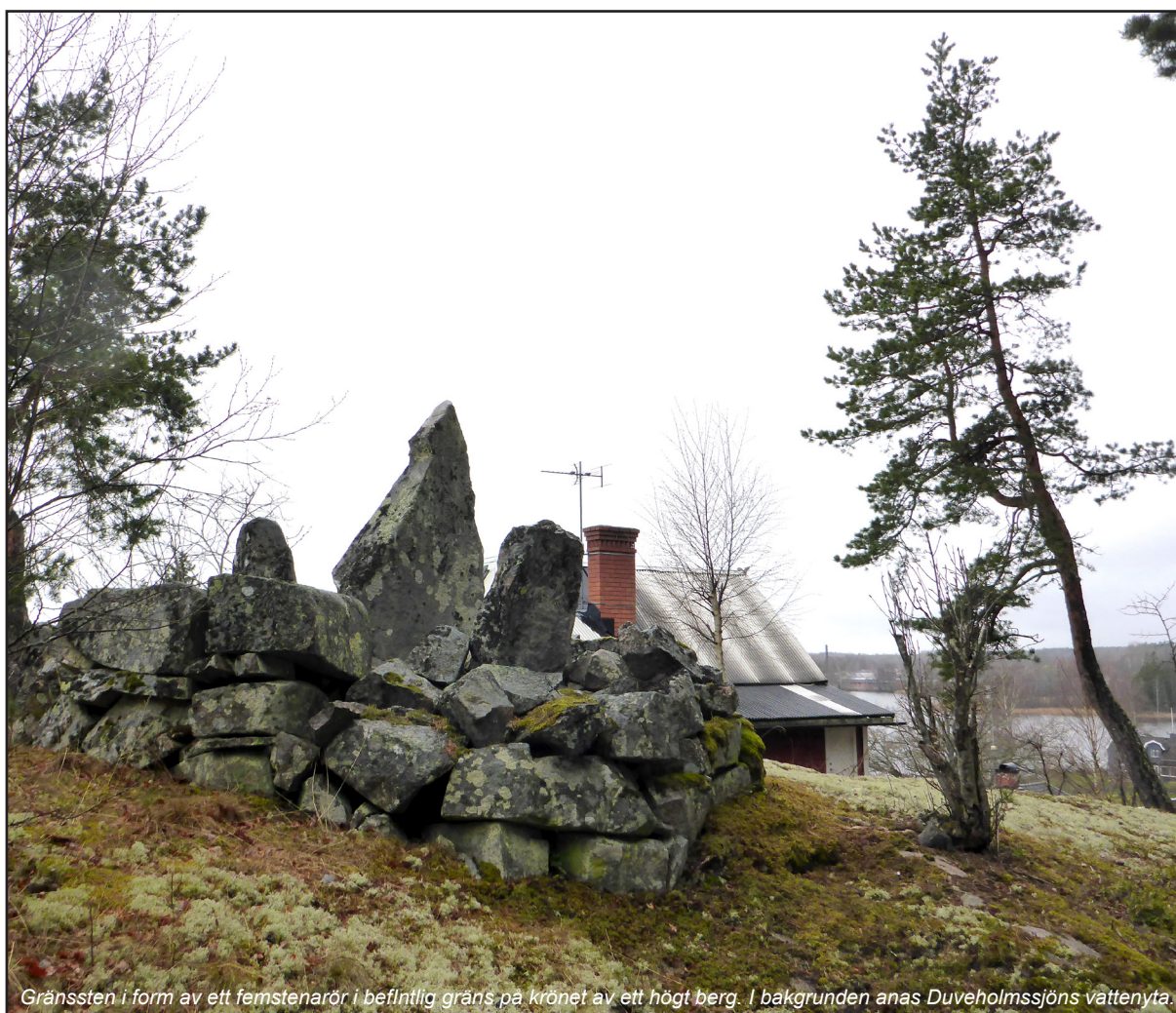
Gränssten i form av ett femstenarör i befintlig gräns på krönet av ett högt berg. I bakgrunden anas Duveholmssjöns vattenyta.