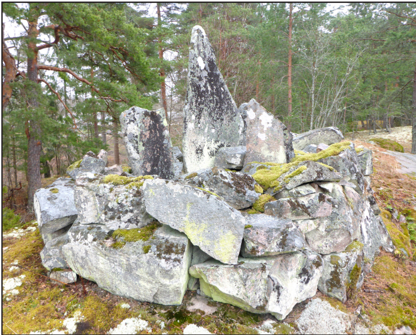
Fig. 1. Objekt 1, ett femstenarör på krönet av ett högt berg sett från sydväst.

Gränsröset klassas som en övrig kulturhistorisk lämning och har genom sin karaktär stora kulturhistoriska värden och bör värnas. Majbrasan och röjningsröset är övriga kulturhistoriska lämningar från sen tid och kräver ingen åtgärd.