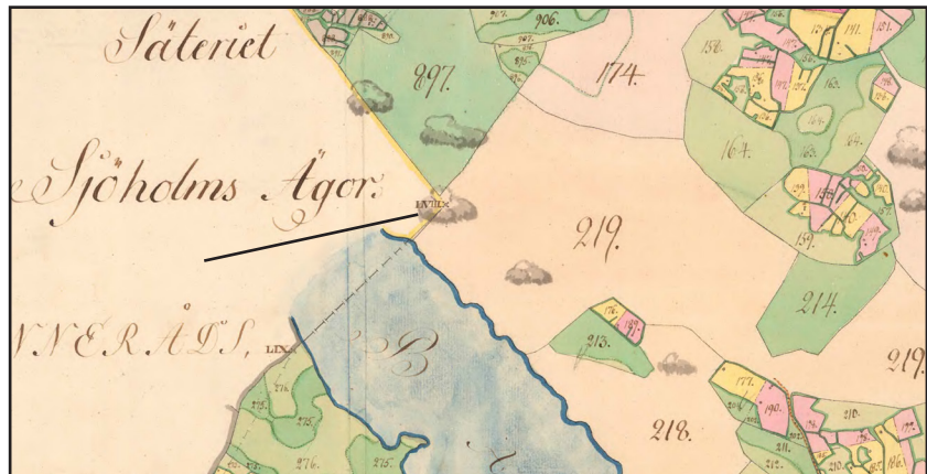
Fig. 4. Vid fastighetsgränsens hörn, se markering, står det på kartan från 1799 "LXVIII". I akten beskrivs LXVIII som "En 5 Stena Stav i rösa Stående uti gårdslegården emellan Hemmanen Ödesdahl och Dahlsängan, Öster om Ödesdahl och Norr om Dahl. Hjerstenen 1,1/3 qv. lång 1/2 aln bred mittuppå....."

Området har varit utmark ända in på 1900-talet då det anlades ett sommarstugeområde och en badplats vid sjön. På 1950-talets ekonomiska karta syns ytterligare några hus, inom utredningsområdet. Enligt uppgift användes de av Katrineholms baptistförsamling.