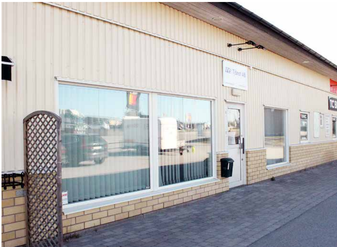
På Starrvägen på Lövåsen ligger VVS Tjänst lokaler i Katrineholm. Huvudkontoret finns i Norrköping

och det passar mig bättre. Jag behöver något att boxas mot. Att gå upp och jobba med samma sak 7-16 varje dag hade jag nog ledsnat på.