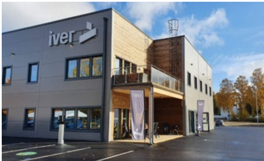
Fler lokaler ger plats för fler etableringar. Sjötorps Byggs nya företagshotell.