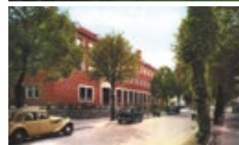
Överst: Posthuset vid järnvägen. Nedan: Posthuset på Fredsgatan på en bild från 50-talet