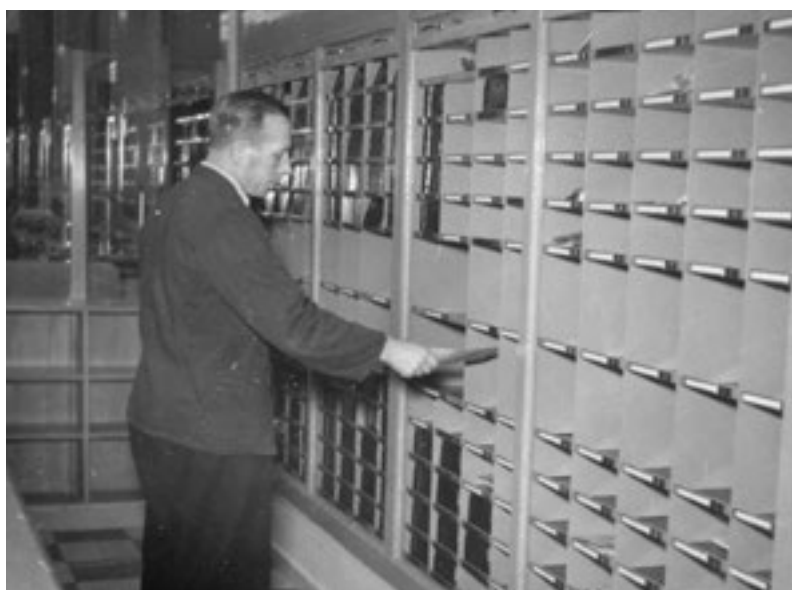
Sortering av post i postboxarna. På andra sidan hämtade boxägarna ut sin egen post.