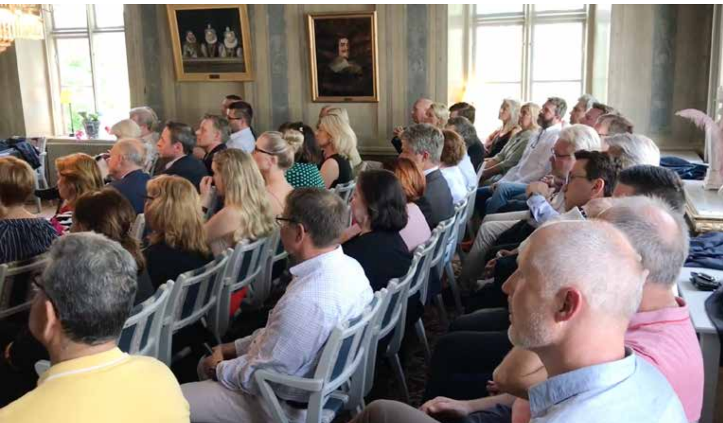
Vårbuffén är en av mötesplatserna för kommunen och det lokala näringslivet.