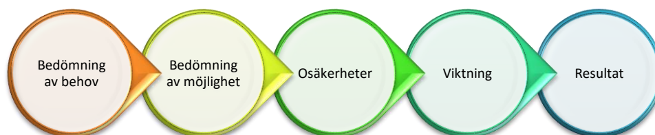
Figur 1 Illustration som redovisar uppbyggnad av det modellverktyg som använts för att bedöma VA-planområdena behov och möjlighet till förändrad VA-situation.

Manualen redovisar nedanstående moment. Tillvägagångssätt för avgränsning av VA-planområden eller vilket underlag som behövs för att utföra bedömningarna redovisas inte här.